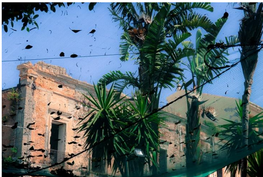
FULVIAA-41 - 40x60 - papier baryté 1/10 - Stéphane DAIREAUX