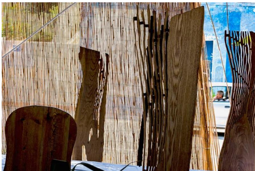
FULVIAA-51 - 24x36 - papier baryté 1/10 - Stéphane DAIREAUX