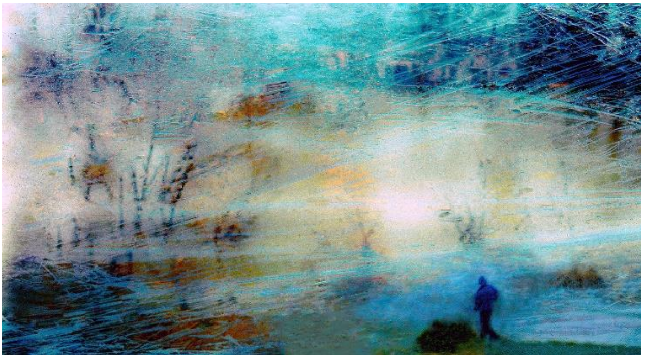
LLENOO # 54 - 36x65 - vitrophanie sur dibond - Stéphane DAIREAUX

Ainsi les deux séries se convoquent sans se compléter, elles en appellent à deux moments de vie, deux parenthèses qui réconcilient l'artiste, peut-être la percée d'un jour de souffrance à travers le temps de sa création. »