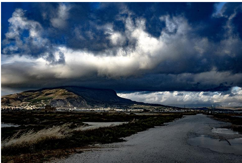
FULVIAA-1 - 24 x 36 - papier baryté 1/10 - Stéphane DAIREAUX