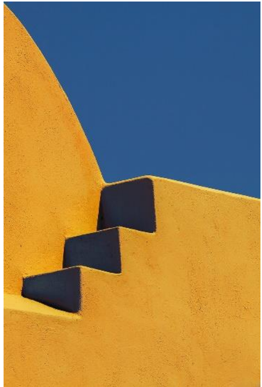
Orange bleue compo 1 - Diane CHESNEL