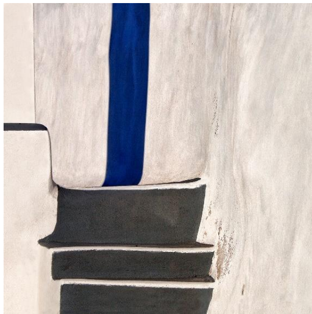
L'ombre bleue - Diane CHESNEL