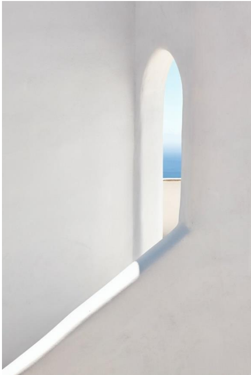
Apparition Egéenne - Diane CHESNEL